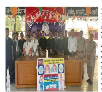
ater Noida, 28th March: I.T.S Dental College, Hospital & Research Centre, Greater Nolda celebrated "World Oral Health Week" from 20th to 26th March 2022 with the theme "Be Proud of your Mouth" to create awareness and to educate people about the importance of Oral Health

I.T.S Dental College celebrates World Oral Health Week, screens over 500+ people for Oral Health issues