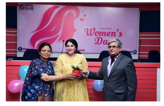
कभी भी किसी भी प्रकार के शोषण को सहन नही करना चाहिए।

parichowk.com March 8, 2022 parichowk.com